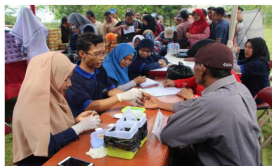
Gambar 4. Pemeriksaan kesehatan rutin di Kabupaten Pati, 7 April 2018