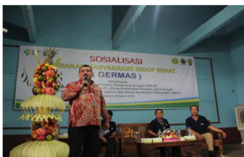
Gambar 1. Pemaparan materi sosialisasi germas oleh Anggota Komisi IX DPR RI di Kabupaten Jepara, 26 Maret 2018

Gerakan masyarakat hidup sehat merupakan upaya untuk meningkatkan kesadaran, kemauan dan kemampuan bagi setiap orang untuk hidup sehat agar peningkatan derajat kesehatan masyarakat yang setinggi-tingginya dapat terwujud. Tujuan umum dari Gerakan Masyarakat Hidup Sehat adalah untuk : (a) Terlaksananya Sosialisasi Gerakan Masyarakat Sehat sehingga mampu menyampaikan kepada masyarakat tentang Gerakan Masyarakat Sehat (b) Tersebar luasnya informasi tentang Gerakan Masyarakat Sehat kepada masyarakat (c) Terselenggaranya gerakan masyarakat untuk Hidup Sehat (d) Advokasi Kepada pengambil kebijakan di tingkat kabupaten, kecamatan dan kelurahan untuk mendukung pelaksanaan Gerakan Masyarakat sehat dalam bentuk kebijakan yang dikeluarkan.