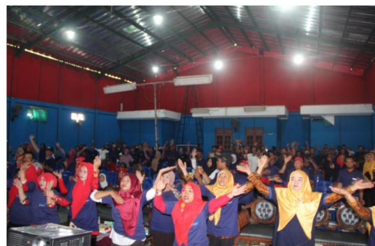
Gambar 3. Senam Cerdik - Peregangan Otot di Kabupaten Brebes, 25 April 2018