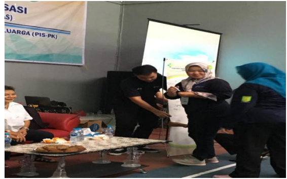
Gambar 3. Penandatanganan Komitmen Bersama