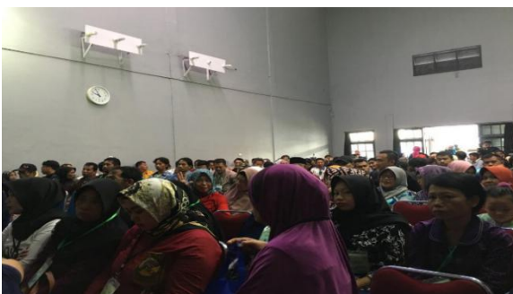
Gambar 2. Peserta Sosialisasi Germas dan PIS-PK