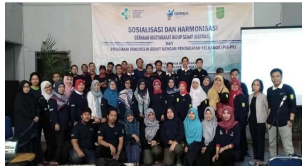
Gambar 4. Foto Bersama di Akhir Kegiatan

Indonesia saat ini tengah menghadapi tantangan besar masalah kesehatan triple burden, karena masih adanya penyakit infeksi, meningkatnya penyakit tidak menular (PTM) dan penyakit-penyakit yang seharusnya tahun 1990 sudah teratasi muncul kembali. Perubahan gaya hidup masyarakat menjadi salah satu penyebab terjadinya pergeseran pola penyakit (transisi epidemiologi) (Kemenkes RI, 2017).