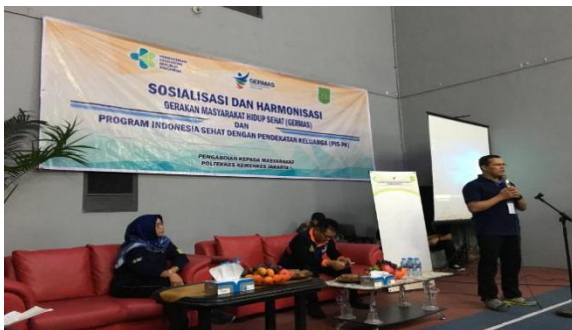
Gambar 1. Sambutan Dinas Kesehatan Kota Sukabumi

Adapun pihak yang terlibat adalah anggota DRR-RI komisi IX, Dinas Kesehatan Kota Sukabumi, Puskesmas Nanggaleng, Tenaga Pendidik dan Kependidikan Poltekkes Kemenkes Jakarta I, tokoh masyarakat kecamatan Desa Nanggaleng, Kecamatan Citamiang dan kader kesehatan Desa Nanggaleng, Kecamatan Citamiang. Pada saat pelaksanaan tidak ada kendala yang berarti dalam kegiatan sosialisasi Germas dan PIS-PK, akan tetapi Kepala PPSDM ataupun yang mewakili tidak dapat hadir pada saat acara karena ada kegiatan dinas luar.