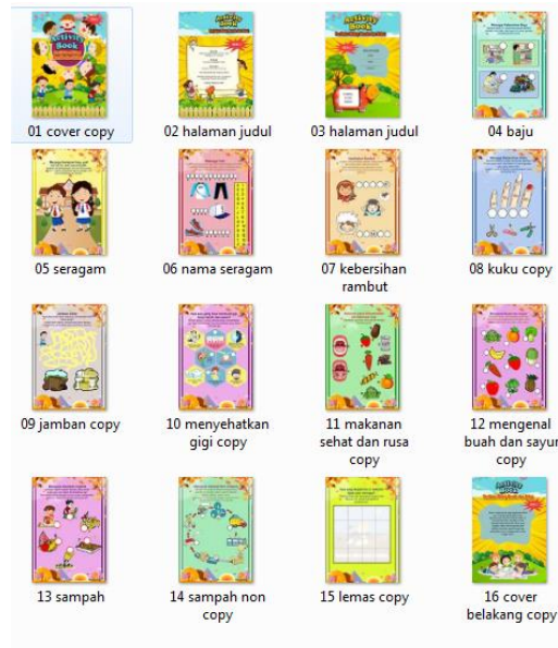
Gambar 2. Activity Book Seri 2

Berdasarkan hasil penilaian dari validator ahli diketahui nilai skor kelayakan sebesar 88 % dengan kategori sangat layak (tanpa revisi), sehingga media “Activity Book Perilaku Hidup Bersih Sehat” dapat dilakukan uji coba produk.