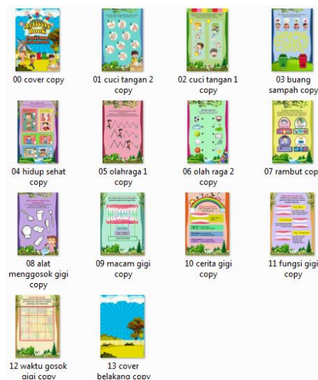
Gambar 1. Activity Book Seri 1

Buku ini berisikan materi diantaranya cara memelihara kebersihan tangan, kuku, rambut, pakaian, gigi, lingkungan dan aktivitas fisik. Media pendidikan pada anak-anak lebih berhasil jika dilakukan dengan media pembelajaran yang tepat dan menarik. Anak usia dini berada dalam dunia bermain.[9] Bermain sambil belajar perlu menggunakan bahan bacaan yang menarik hati anak. Sehingga materi yang akan disampaikan dapat mudah dipahami oleh anak.[10] Activity Book melatih kemampuan motorik halus anak karena anak belajar dengan menggunakan alat tulis. Anak dapat melakukan aktivitas di dalam Activity Book Perilaku Hidup Bersih Sehat. Dalam activity book dibuat berwarna-warni, terdapat berbagai macam kegiatan, dan merangsang kreativitas anak sehingga pembelajaran lebih menyenangkan. Media ini praktis, karena dalam satu buku terdapat berbagai macam aktivitas sehingga dapat menunjang keterampilan motorik halus anak.[11]