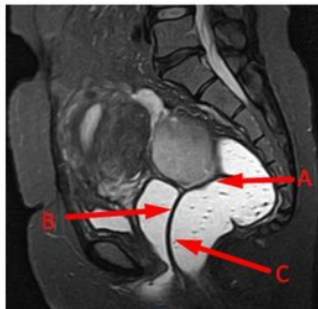
Gambar 1. Hasil gambaran MRI Pelvis dengan menggunakan ultrasonic gel

Alasan penggunaan ultrasonic gel pada pemeriksaan MRI Pelvis di Instalasi Radiologi Mayapada Hospital Jakarta adalah untuk menegakkan diagnosa pada Kasus Endometriosis terutama deep infiltrating endometriosis (DIE). Penggunaan ultrasonic gel sangat membantu dokter menegakkan diagnosa pada kasus endometriosis karena endometriosis adalah penebalan didinding endometrium tapi bukan pada tempatnya, yang paling umum itu di myometrium, perimetrium, tuba fallopi, ovari, dan vagina, yang lebih parahnya bisa di organ diluar pelvis contohnya ada sedikit kasus yang sampai ke mata, tapi jarang sekali terjadi, jadi dengan adanya penggunaan ultrasonic gel hasil gambaran MRI pada kasus endometriosis lebih jelas perbedaannya antara jaringan normal dengan jaringan patologis, contohnya antara rongga pelvis, rongga rectum dan kelainan. Selain itu penggunaan ultrasonic gel juga memperlihatkan batas-batas antar organ contohnya rahim ke rectum, batas antara kandung kencing sama rahim, jadi walaupun endometriosis yang paling kecilpun akan kelihatan, Seperti gambar di bawah ini :